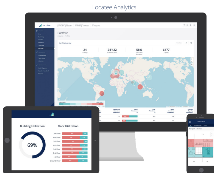
Locatee Smart Signage

Locatee ermöglicht entscheidende Geschäftsvorteile: Von der portfolioweiten Flächennutzung bis hin zur Verbesserung des Arbeitsalltags jedes einzelnen Mitarbeitenden.